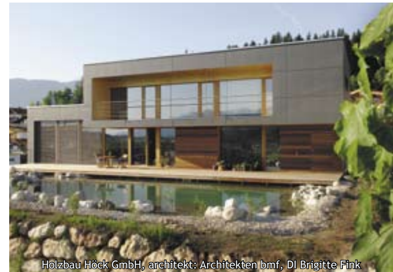
Hölbau Höck GmbH, architekt: Architektinnen bmf, DI Brigitte Fink